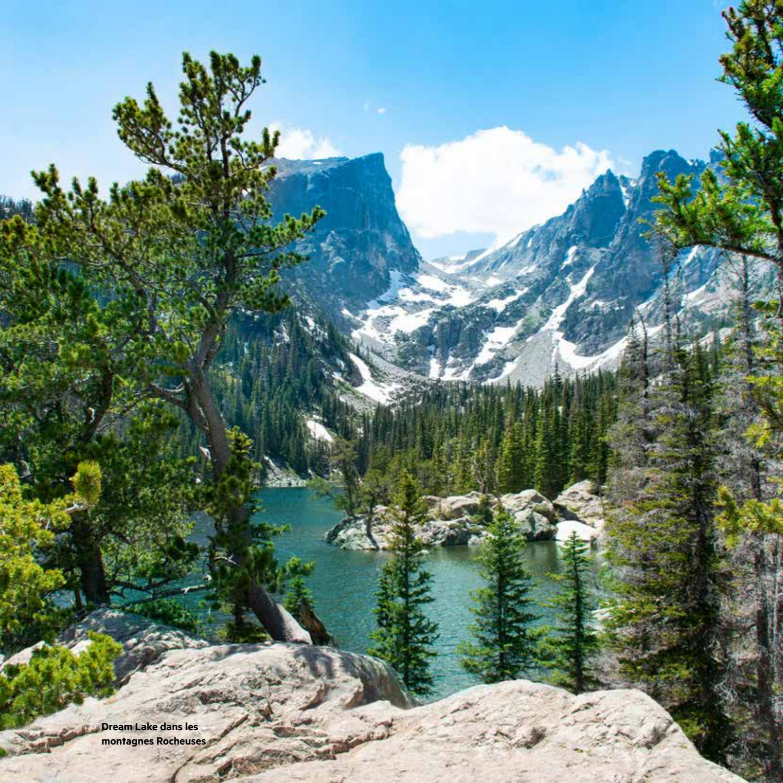
Dream Lake dans les montagnes Rocheuses