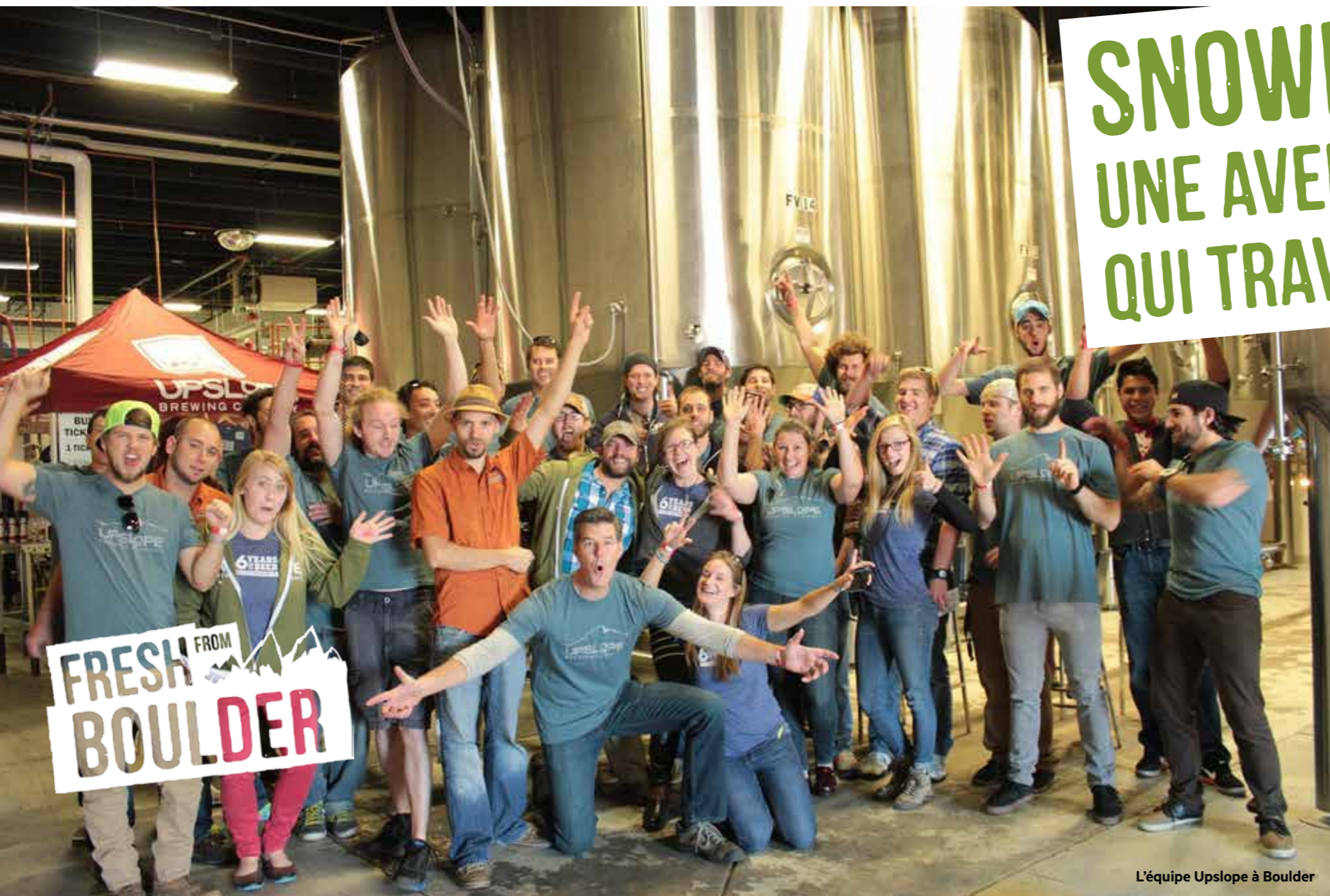
L'équipe Upslope à Boulder