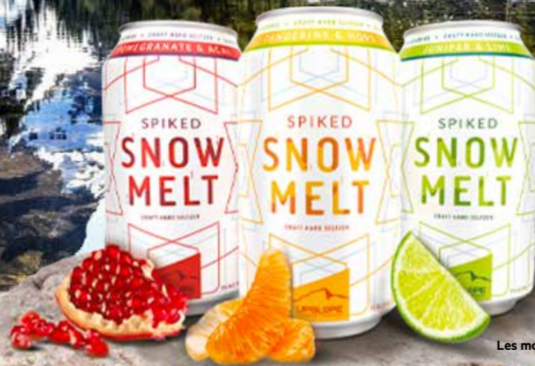
Les montagnes Rocheuses du Colorado