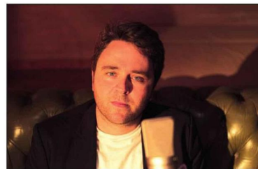
À voir le 24 mars.

The Call of Life, mardi 24 mars à 20h, salon de musique 13, 95 avenue Raoul Francou, Salon-de-Provence. www.salondemusique13.fr Tarifs de 8 à 18 €. 04 90 53 83 97.